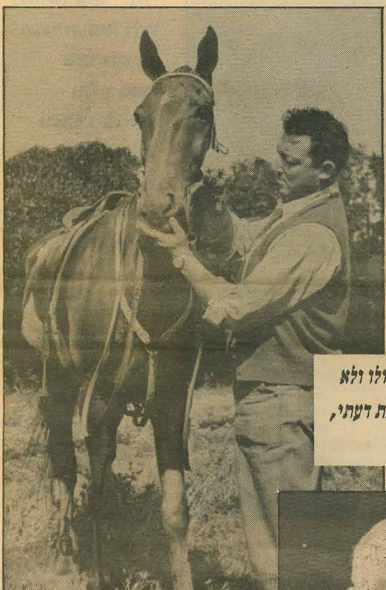
זמוש בפרגוואי, בעת החיפושים אחרי מנגלה

עד מהרה התחוויר לזמוש שהוא מחפש את מנגלה במקום הלא נכון. הוא אמנם לא ידע מה שידוע היום לכל - מנגלה נמלט מארגנטינה מיד לאחר לכידתו של אייכמן - אבל כבר אז קבע כי מנגלה עזב את ארגנטינה ועבר לברזיל. אבל איש הקשר שלו לא הסכים אתו. המידע שהיה בידי המוסד קבע שמנגלה עדיין בארגנטינה, וכי הוא רק נוסע מדי פעם לפרגוואי. זמוש נדרש אפוא להמשיך ולחפש בארגנטינה ובפרגוואי. בשנת 1961 אפילו התבקש לברוק אמיתות של מידע שהגיע ולפיו כלב הבוקסר של מנגלה נמצא אצל מכר